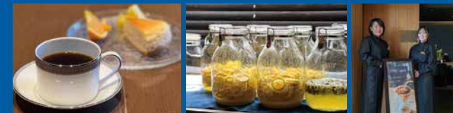
Haluhi.のチーズケーキ600円 日替わり焼菓子400円～

コーヒーについてうんちくを語る人が急増するほど、ここ何年かコーヒーが注目されています。確かに深い世界ではあるけれど、人それぞれ好みとその日によって飲みたくなるコーヒーも変わってくるもの。ただ、ほっとしたい時や予定のない時間をコーヒーとともに過ごすのは、誰にとっても至福の時間でもあります。白浜のホテル「キータラス ホテルシーモア」1階のKON BARでは「AO cafe」がプレオープン中。毎日ていねいにハンドドリップで淹れるコーヒーが好評です。仕事や読書のほか、考え事をしたり、空想したり、ただただのんびりと過ごせる場所。忙しい大人にとって必要な事ですね。それからそれから、お待ちせしました。4月から醸酵ドリンクも販売されますよ。レモン・キウイ・早生みかん・ポンカン・紅玉りんご・青りんご・キンカン・柿などが目見え。楽しみで仕方ないと言う人も多いのでは？コーヒーと醸酵ドリンクで体と心を癒しましょう。