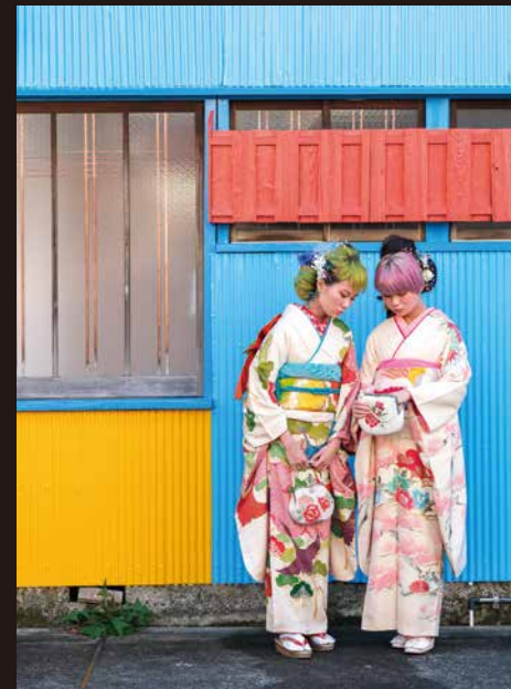
ヴィンテージビーズバッグもお洒落!