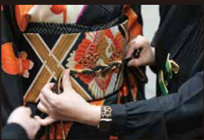
半襟、帯揚げ、帯締めなどの小物選びはとても重要。何を合わせるかセンスが求められます。