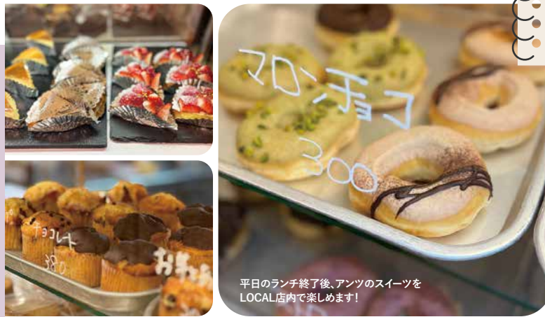
平日のランチ終了後、アンツのスイーツをLOCAL店内で楽しめます！

昔からのおやつといえば、ドーナツ。サクサク系が好きという人もアンツのモチっとしていて、それでいて軽いドーナツを食べてからというもの、そのおいしさに夢中になってしまったという人が毎日のように買いに来るほど人気なんです。ふんわりモチとした生地そのものの味わいが楽しめるシンプルなものから、レモンクリームやチョコレート、イチゴ、ピスタチオ、胡麻など豊富なメニューがずらりと並んでいます。他にもシュークリーム、しっとりふわふわの台湾カステラ、みずみずしい季節のフルーツのおいしさが楽しめる香ばしいタルト、小さなお子さんも安心して食べられるマフィンなどアンツの魅力は語りつくせないほど。毎日のおやつタイムに、差し入れに、お土産に…。喜ばれるお菓子を、ぜひ！