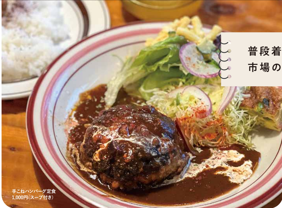
手こねハンバーグ定食 1,000円(スープ付き)

ひとこと 2024年1月1日は甲子の日+天赦日+一粒万倍日。「甲子の日」は、干支の中で一番目の組み合わせとなる縁起のいい日。財運・金運・商売繁盛の大黒天と呼ばれる神様と縁のある日と言われる。「天赦日」は1年に5、6回しかない、暦の中でも最もよい大吉日。天が万物の全てを許す日で、もちろん金運にも吉日。「一粒万倍日」は金運とともに新しい物事をスタートするにはぴったりの縁起のいい日。これらが重なる1月1日。感謝の気持ちを込めながら、お財布を綺麗に磨いてお手入れしましょうか。