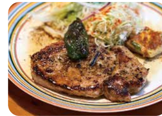
トンテキ ベッパー1,200円(スープ付き)/ビーフカレー1,000円(サラダ・スープ付き)他にチキンカツカレー・メンチカツカレー・スクランブルエッグカレーなど色々

市場内の洋食屋さんとして人気のLOCAL。ハンバーグやエビフライ、サーモンフライなどの他、季節によって味わいやコクを変えるカレーも見逃せないメニューです。ランチタイムのみの営業だから、集中するたくさんのメニューを1人でこなすので十分な仕込みが必要。「暑い日や寒い日によって調理時にいろんなアレンジをします。お客さんは気づかないかもしれないけど、おいしく食べてもらうために微妙に変えてるんです」限られた昼休憩だから、できるだけ早く、おいしく。これがこの店のモットーです。女性客、カップル、サラリーマン、家族、市場で働く人、様々なお客さんが洋食ランチを楽しみに来店。今年もLOCALでお腹を満たして！