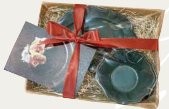
studio m' のカップとお皿のセット5,390円