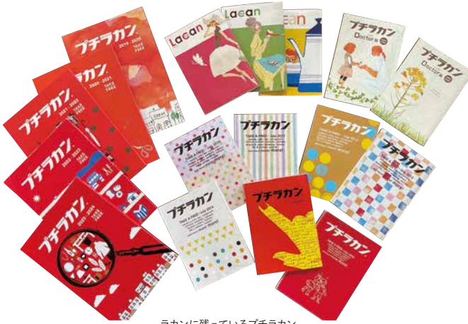
ラカんに残っているプチラカン。欠けている号が...残念。