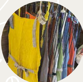
色とりどりのリネンエプロン各7,480円

いい靴下は足の疲れが違います。MOKUの靴下1,650円/"履くタオル"で人気のコンテックスの靴下1,430円