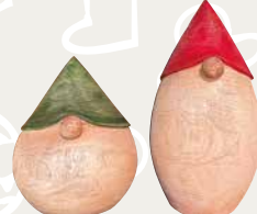
木製サンタさん(緑)1,430円・(赤)1,650円