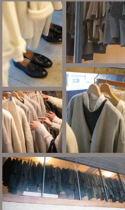
シャツの他にパンツ、カーディガン、ニット、コートなど。

ギフトパッケージがMUYAらしい。着物を美しく保管するための紙「たとう紙」からヒントを得て作ったもので、内ひもを結んだあと上側をかぶせてさらに2ヶ所結びます。服を大切にしながら包むとともに贈る人の気持ちも込めながらラッピング。素敵な贈り物によってそれぞれの気持ちをほんわり暖かくしてくれるはず。(ギフトパッケージは有料です500円)