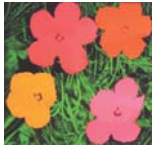
フラワーズは平面的で尾形光琳の紅白梅図屏風の影響があるように思える。