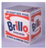
ウオーホルの初期の代表的な作品、ブリロ・ボックス（洗剤）1964年木製合板にシルク・スクリーン。アメリカの代表的なスチールワール洗剤の外箱をそのまま複製にした作品デュシャンの泉からの影響がみてとれる。