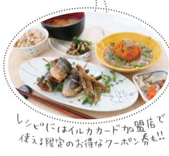
レシピにはイルカカード加盟店で使える限定のお得なクーポンも!!

いつもの料理教室のように和気あいあいと料理に励む女性たち。その後ろのテーブルには...? いつもの食器と違う食器が? それに食材紹介のポップにはお店の名前。実はこの日の料理教室の主催は田辺商店街のイルカカード。商店街のお店主催で料理教室って? と思う人もいるかもしれませんが、今回の料理教室はイルカカード加盟店の店主さんたちが、イルカサポーターという一般の主婦たちと一緒に考えた企画なんです! 子どもを預けて何かを学べる機会が欲しい! という声を受けての今回の企画は、イルカカードを持つ人なら誰でも参加できる料理教室で、託児(3時間)もついて参加費はなんと1500円! 途中、加盟店の店主さんたちが顔を出したりして終始和やかに楽しい雰囲気。最近はずっと中心の生活で料理に時間をかけていないから不安... と言っていたお母さんも、楽しそうに大量のサツマを3枚におろしたりしていましたよ。次回は12月に開催されるそうなので、興味のある方は申込んでみて!