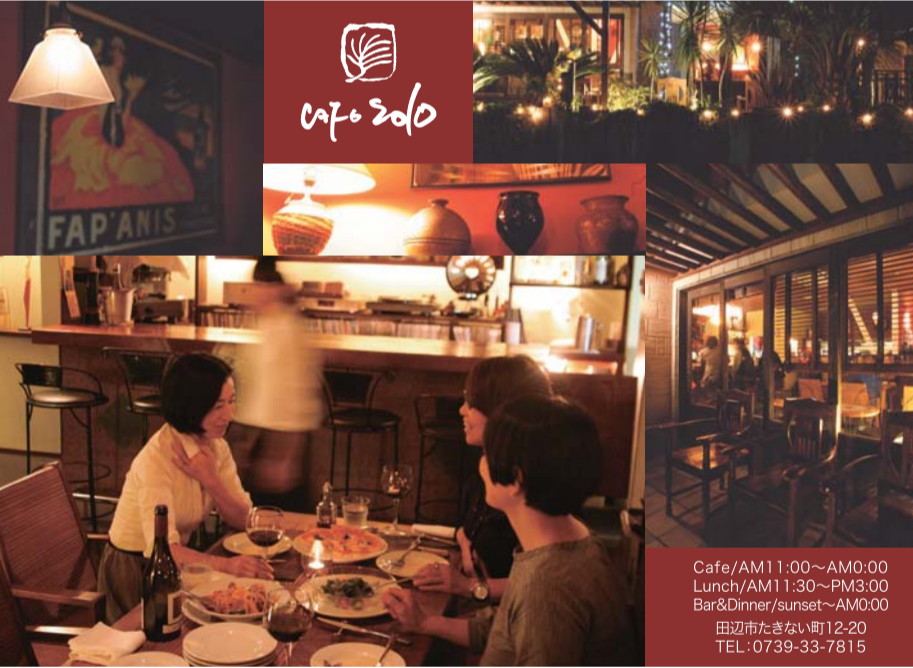
Cafe/AM11:00~AM0:00 Lunch/AM11:30~PM3:00 Bar&Dinner/sunset~AM0:00 田辺市たきない町12-20 TEL:0739-33-7815