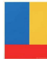
SMAP 「S map ～SMAP 014」

文章表現は難しい、特に枠内で伝えるには尚更だ。だからテーマを決めることや無駄を省き読んでもらうにはどうすればいいのか何度も考える。タイトルや写真から本文へ導くには？考えを伝えるには？でもコラムを書くようになって、文章表現って何となくデザインと似ている気がする。例えばロゴや文章を作るにもまず素案を考え、具体化できても何度も校正して完成度を高めようと努力して修正するところがなくなるまでつめる。でもいつも最後には自己満足で終わってしまう…。(笑)