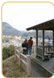
京都から熊野三山を巡って往復約650kmを、多くの人たちが困難を乗り越えて歩いてきたんだ。