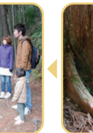
AM9:40 “道の駅 熊野古道なかへち”を出発!大人も子どもも元気!!