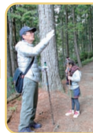
教科書に載っている歴史上の人物(後白河法皇や後鳥羽上皇etc...)もこの道を通ったんだ…。ココに立つと歴史の深さを感じます。