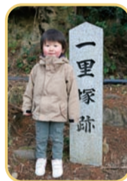
その昔、一里(約4km)ごとに松が植えられ、休憩する目印にしていたそう。