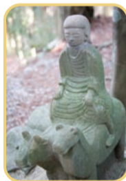
牛と馬の背中のにった花山法皇の旅姿“牛馬童子”に到着。