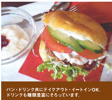
パン・ドリンク共にテイクアウト・イートインOK。 ドリンクも種類豊富にそろっています。

ベーカリーカフェ・ノワ JR紀伊田辺駅構内 TEL:0739-26-5628 営業時間 6:30~19:00/火曜定休日